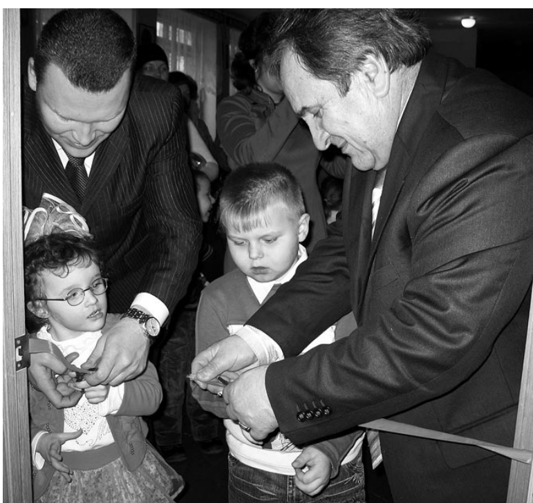
Самый ответственный момент.